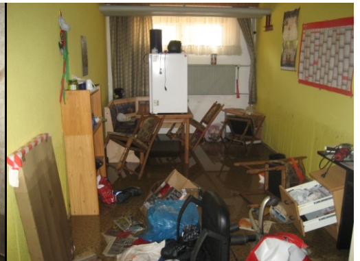
Fotos privat, Kita "Badeteichstraße der Johanniter-Unfall-Hilfe e.V., Magdeburg